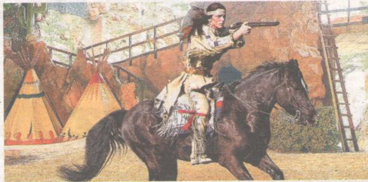
Winnetou kämpft gegen die üblen Machenschaften des Ölprinzen an.