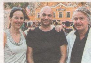
Vera Russwurm und ihr Mann Peter Hofbauer plaudern mit Martin Exel.