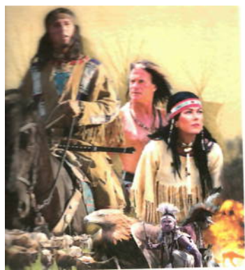
... wird auf der Naturbühne Gföhlerwald „Winnetou & Old Shatterhand“ in Starbesetzung geboten.